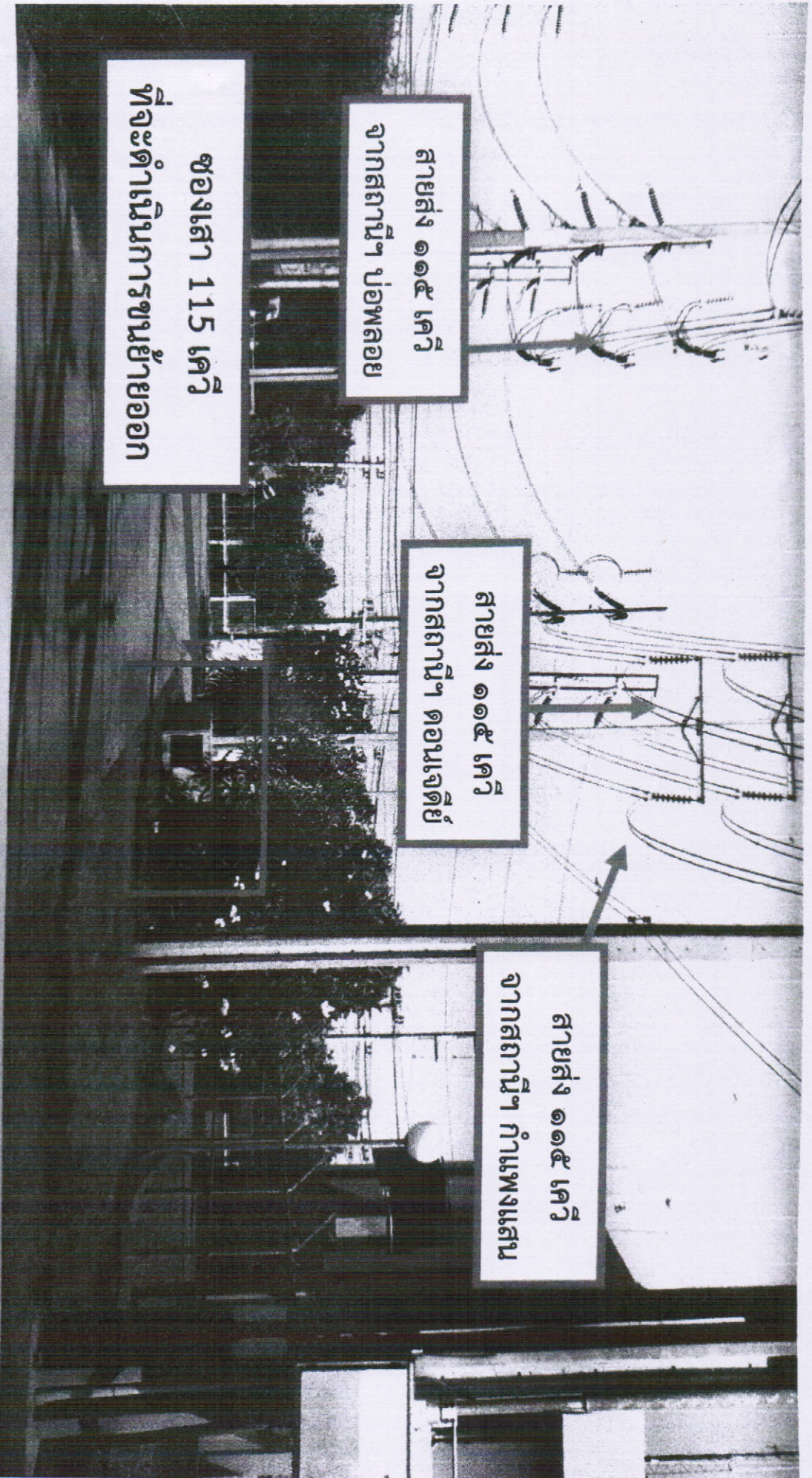
รูปหน้างานจริง